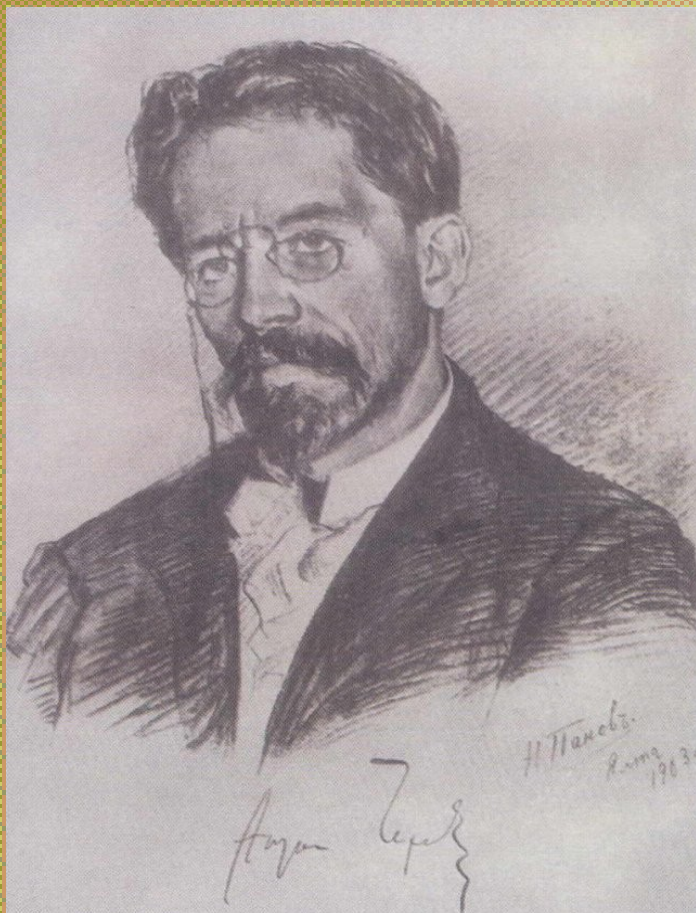
Антон Павлович ЧЕХОВ (1860-1904 гг.)